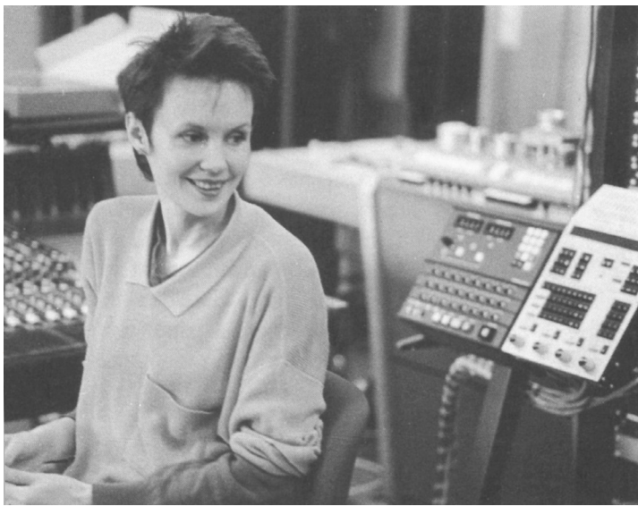
Abb. 3: Kaija Saariaho.

Saariaho arbeitet nicht zu den typischen Zeiten der konventionellen Arbeitswelt, sondern nachts, nicht an einem Konzertflügel oder in einer Villa, sondern in einem Keller an stummen Maschinen, nicht in Finnland, sondern in Paris, und die Komponente romantischer Inspiration oder konservativer Handwerklichkeit ist durch die Frames Forschung und Technologie ersetzt. Diese Gegen-Konstellation soll im Folgenden in ihren Bestandteilen differenzierter analysiert werden.