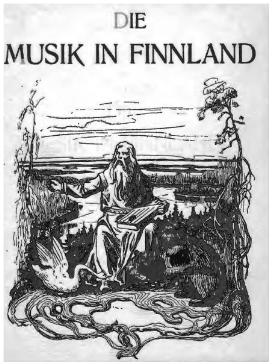
Abb. 1: Karl Flodin, Die Musik in Finnland: Titelbild (Public Domain)

Zwar sind Werke finnischer Komponisten bereits aus dem 17. Jahrhundert bekannt, doch entwickelte sich das Konzept genuin finnischer Musik erst gegen Ende des 19. Jahrhunderts. Dabei