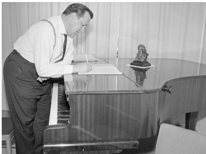
Abb.: 2 Joonas Kokkonen (Ausschnitt).